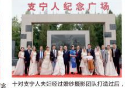
十对支宁人夫妇经过婚纱摄影团队打道过后，在摄影师的指导下拍摄婚纱照