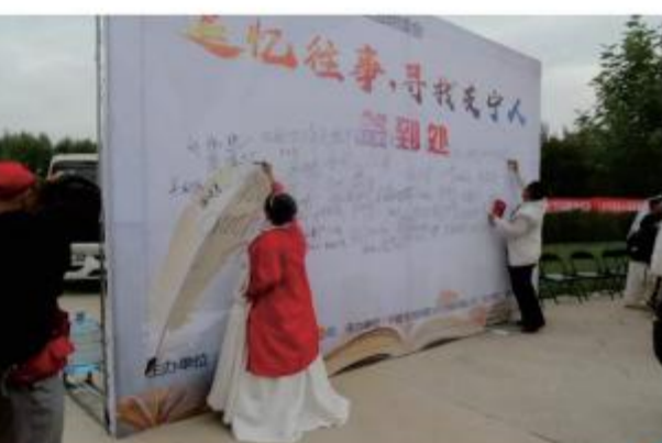
(中场休息，嘉宾在工作人员引导下前往签到墙签字)