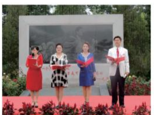
(宁夏朗诵协会在台上朗诵精心准备的作品)

活动当天，一些年轻人还在环境优美的支宁人广场拍照留念，并表示他们将来的婚纱照也在支宁人广场拍摄。