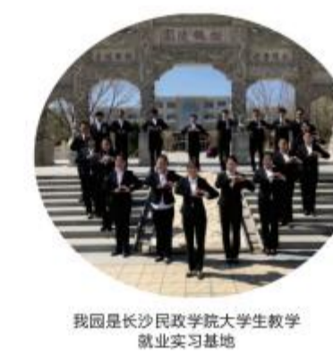
我园长沙民政学院大学生教学就业实训基地