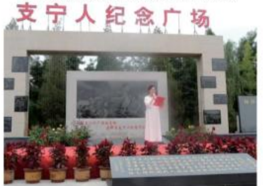
(宁夏朗诵协会会员在舞台上朗诵精心准备的篇章)