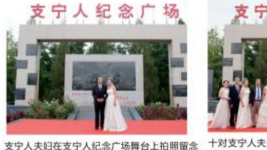
支宁人夫妇在支宁人纪念广场舞台上合影留念