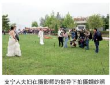
支宁人夫妇在摄影师的指导下拍摄婚纱照